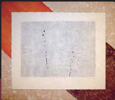
第57回 額装の部「大阪府知事賞」受賞作品