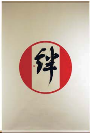
掛軸「絆」八上武幸 八上松竹堂(大阪府堺市) 本紙作家名:藤永清香