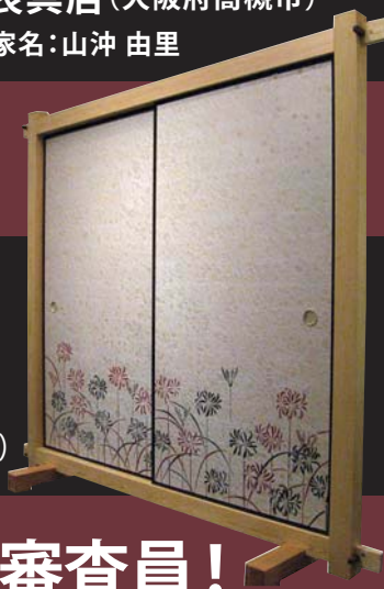
第57回 表装の部「大阪府知事賞」受賞作品